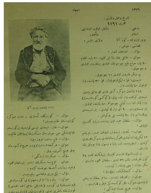
İctihad, no-63, 138 Yaşında, r. 1376

Piştî 118 salan êdî jinêti û mêretî bi dawî hat... Vê gavê dil heye lê meydanê tiştêkî tune ye (sîngê xwe nişan dide) ev der dişewite lêbelê... Zarokê min ê lawîn di 80ê salîya xwe de mir. Min ew xweyî dikir. Li ser mirina wî 9 meh derbas bûn. Vê gavê birayekî min ê 90 salî heye, piştî wî xwar bûye.