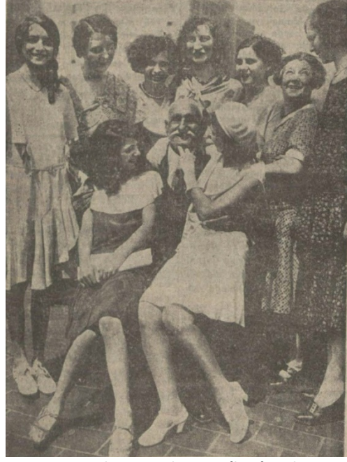
Zoro Axa li Newyorka Amerîkayê, Vakit, 13ê Axustosa 1930